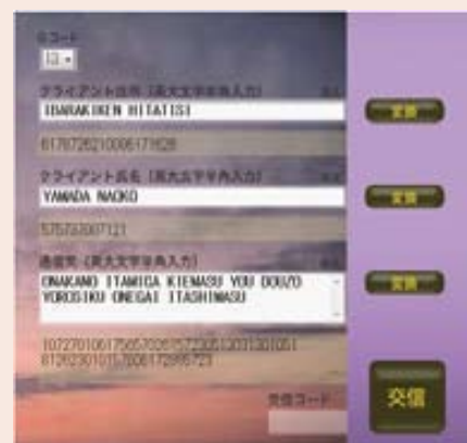
祈りのセラピー画面