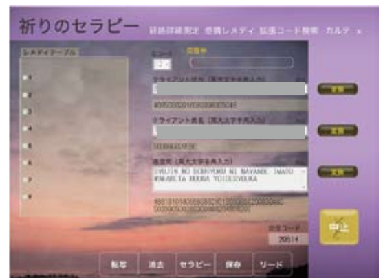
祈りのセラピー画面

お申込みが完了しましたら、右の画面にて「祈りのセラピー」を行います。セラピー終了後、実施内容をお客様へ郵送でご連絡いたしますので、セラピー料を下記の口座へお振り込み下さい。 また、ユーザーでない方は、「準ユーザー登録」が必要となりますので、登録料（年会費）6,000円をセラピー料と一緒にお振り込み下さい。