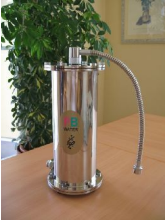
PBウォーター製造装置

PBW（プレバランス・ウォーター製造装置は、ゼロバランス誘導調整装置でフォーマットされた水を「愛と調和」のエネルギーに変換する装置です。これにより、様々なストレス（人間関係、電磁波、汚染物質など）によりバランスが崩れた生体水を、すべて調和の方向に導きます。